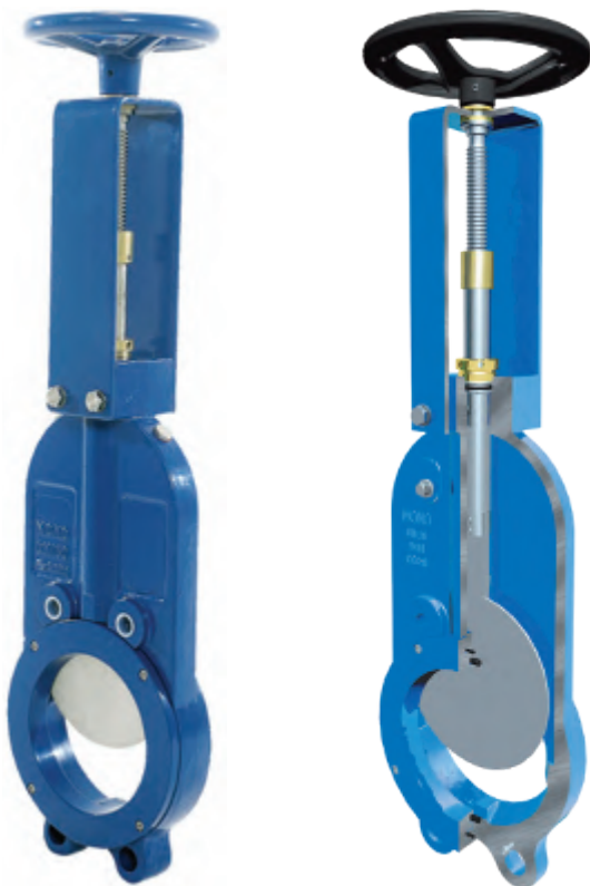
VAG MONO®, вид в разрезе